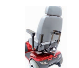
04060548: Soporte botella de oxígeno