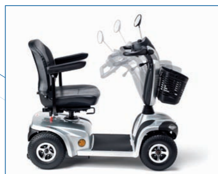
Columna de conducción