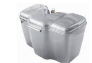
04060551: Baúl delantero