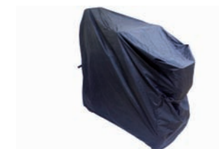
04060552: Funda de almacenaje