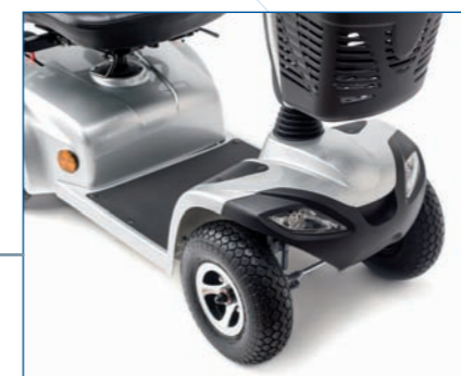
Kit de luces delanteras y de freno