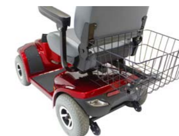
04060549: Cesta trasera