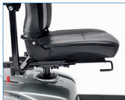
Asiento regulable en profundidad