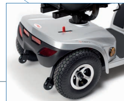
Palanca de desembrague y ruedas antivuelco